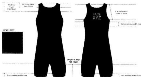
UWW Singlets/ Women/ Red stripes