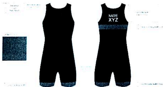
UWW Singlets/ Women/ Red stripes